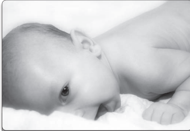
Vaše dieťaťko Vám neustále niečo "hovori".