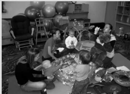
Keď je dieťa pripravené na prácu v kolektíve, je vhodné navštíviť kurz, kde dieťa motivujeme, aby sa učilo nové znaky a aby ich začalo používať.