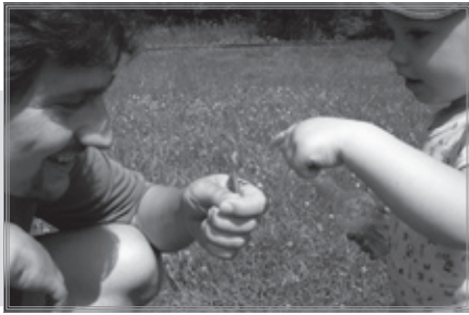
Znakovanie súvisí s teóriou zameranej pozornosti. Keď rodič zistí, že dieťa sleduje ten istý predmet, slovo alebo znak, aký mu chce predstaviť, môže ho pomenovať a ukázať dieťaťu, akým spôsobom sa s predmetom manipuluje.